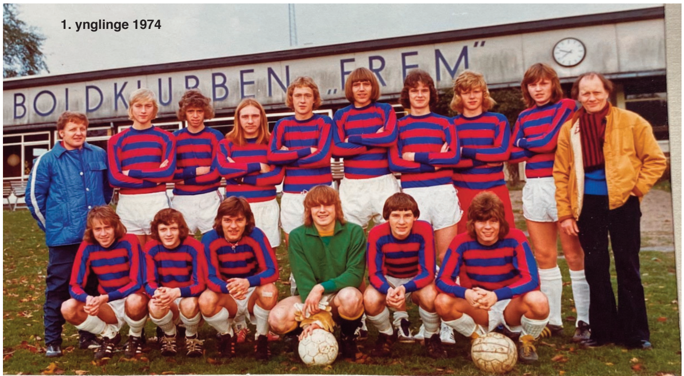
1. ynglinge 1974