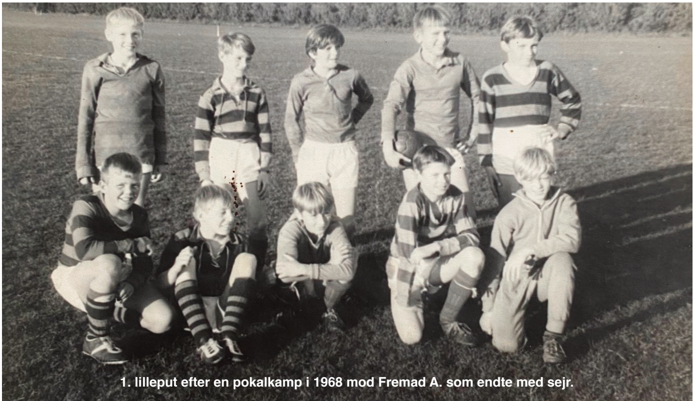
1. lilleput efter en pokalkamp i 1968 mod Fremad A. som endte med sejr.