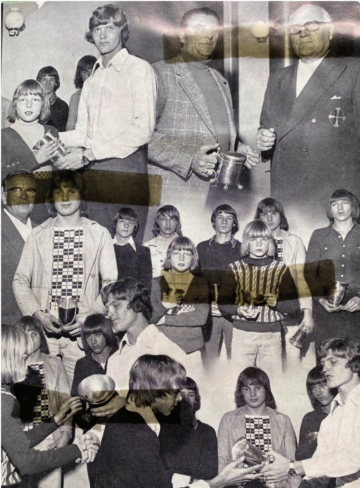
Uddeling af pokaler på Ellebjerg Skole